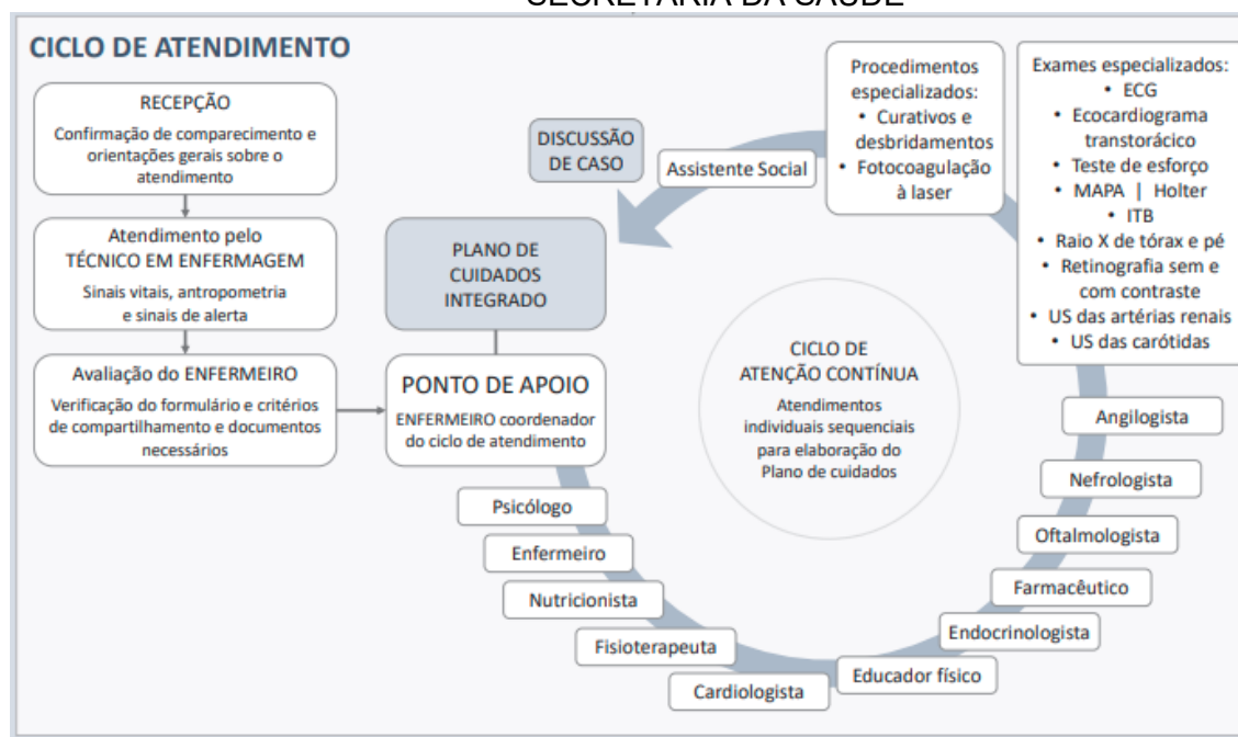
Figura 1: Ciclo de atendimento da atenção contínua (SOCIEDADE BENEFICENTE ISRAELITA BRASILEIRA ALBERT EINSTEIN, 2020, p. 64).