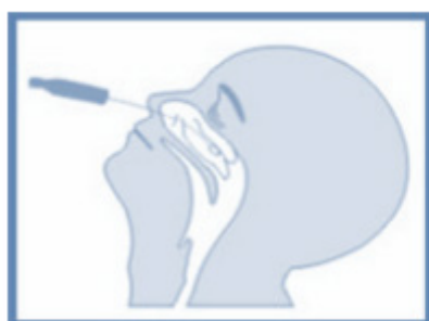
Figura 2. Técnica para a coleta de swab combinado